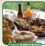
Produtos Mulheres da Prata