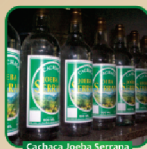
Cachaça Joeba Serrana