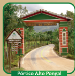
Pôrto Alto Pongal