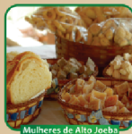
Mulheres de Alto Joeba