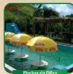
Piscina da Dilza