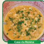
Casa da Nonna