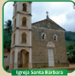
Igreja Santa Bárbara