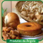
Produtos da Ângela