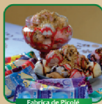
Fabrica de Picolé