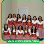
Grupo de Dança Nonna Adelia