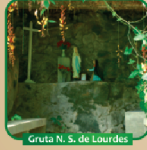
Gruta N. S. de Lourdes